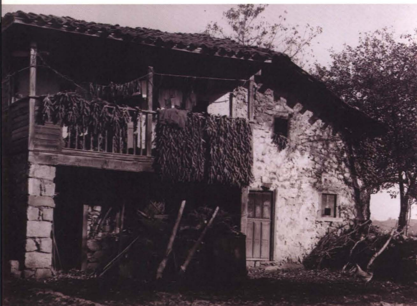
VILLAMAYOR: LA ENTRADA AL PUEBLO. 13 x 18 cm.