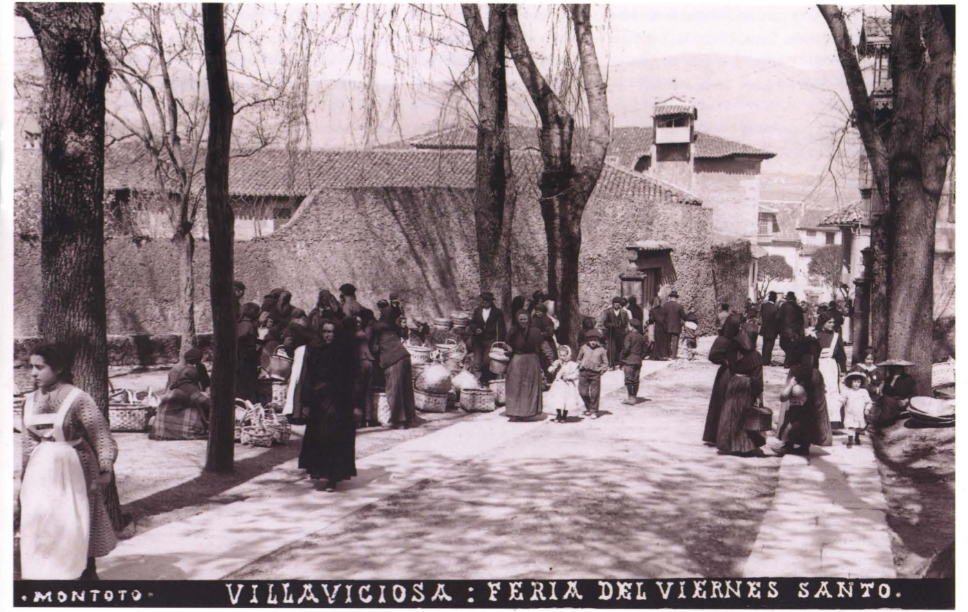
VILLAVICIOSA: FERIA DEL VIERNES SANTO. 10 x 15 cm.

El archivo fotográfico de Montoto, aunque se conserva en gran parte, padeció algunas pérdidas, que hacen que la presente exposición no refleje en su totalidad el ámbito geográfico que abarcó nuestro fotógrafo en su periplo asturiano. En la revista mencionada aparecen vistas de los concejos de Cangas