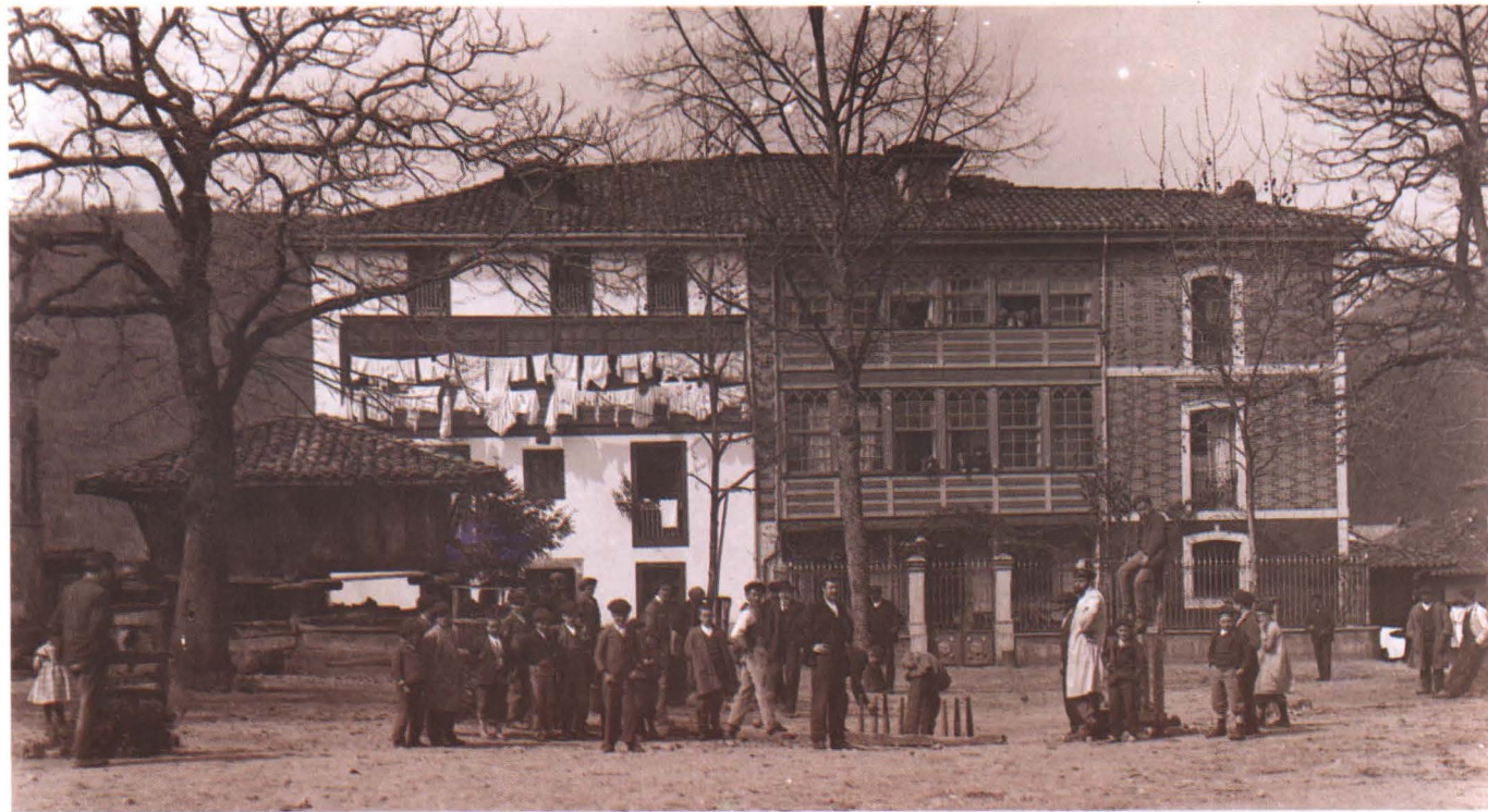
RIBESSELLA: PUENTE SOBRE LA RIA, 1910.