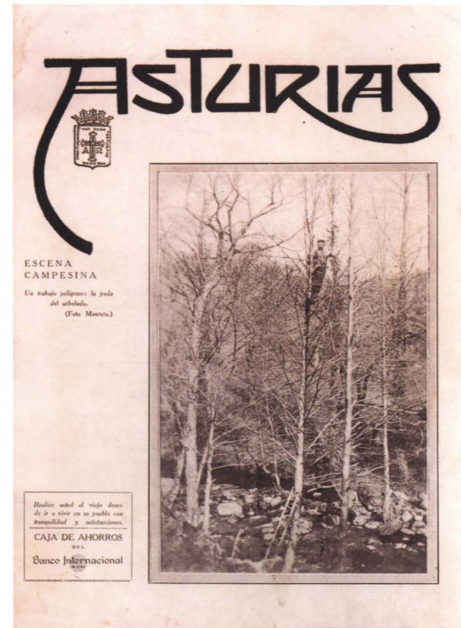
PORTADA DE LA REVISTA ASTURIAS (LA HABANA) CON UNA FOTO DE MONTOTO

La riqueza de imágenes que contiene el archivo de placas de cristal que guardan los descendientes de Montoto ha servido para organizar este año la exposición "Villas y espacio rural en Asturias, 1900-1925", en la que se muestra el aspecto de las villas asturianas y de los espacios rurales circundantes. Las primeras eran las capitales de los concejos, constituyendo los centros comerciales y administrativos del territorio. En el espacio rural predominaban los pueblos pequeños con un caserío concentrado o diseminado, en los que el corredor era el elemento más visible de las casas campesinas. Asimismo, quedan reflejadas en las fotos algunas de las transformaciones, que gestadas en la segunda mitad del siglo XIX, estaban en pleno auge en el primer cuarto del siglo actual: las fábricas de azúcar