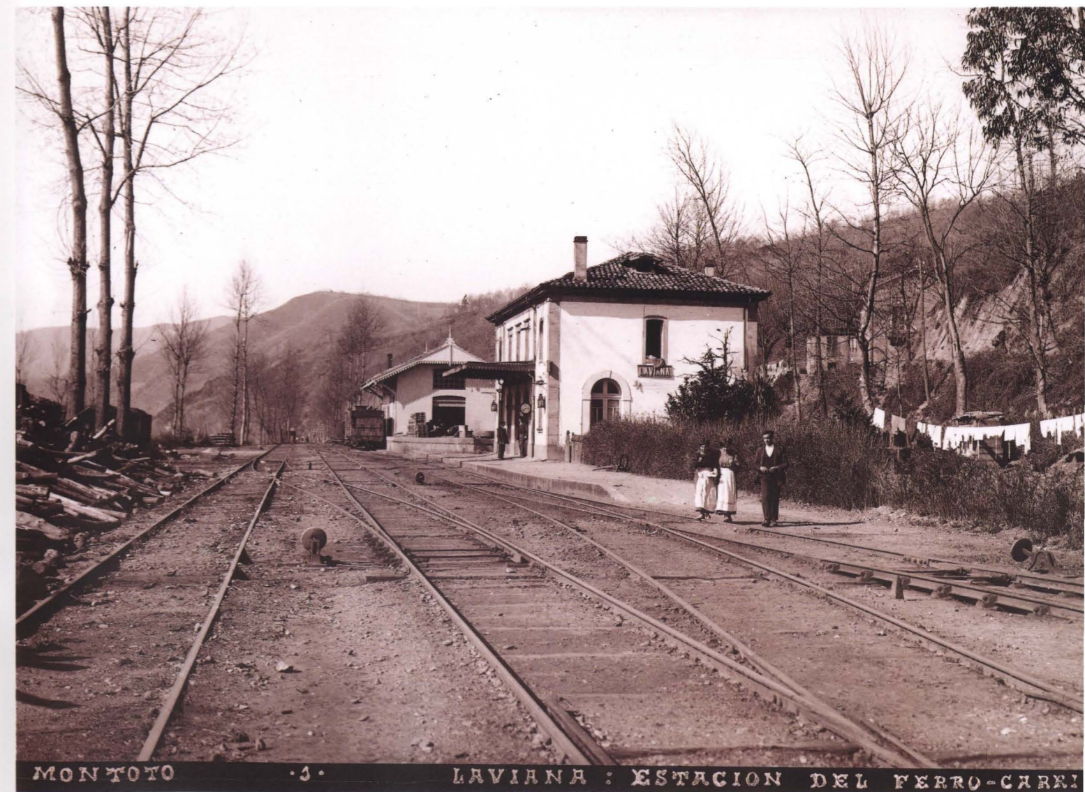
MONTOTO. 3. LAVIANA: ESTACION DEL FERRO-CARRIL