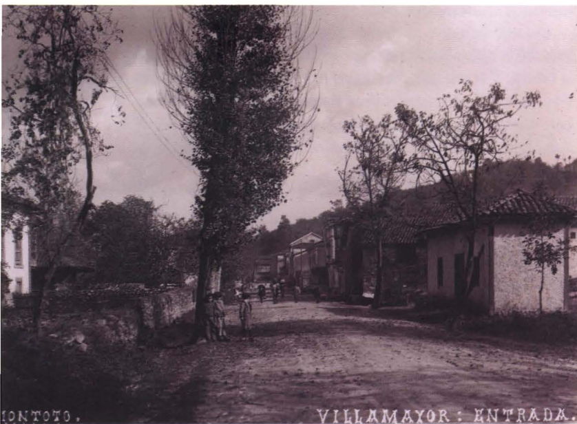
MONTOTO. VILLAMAYOR: ENTRADA.