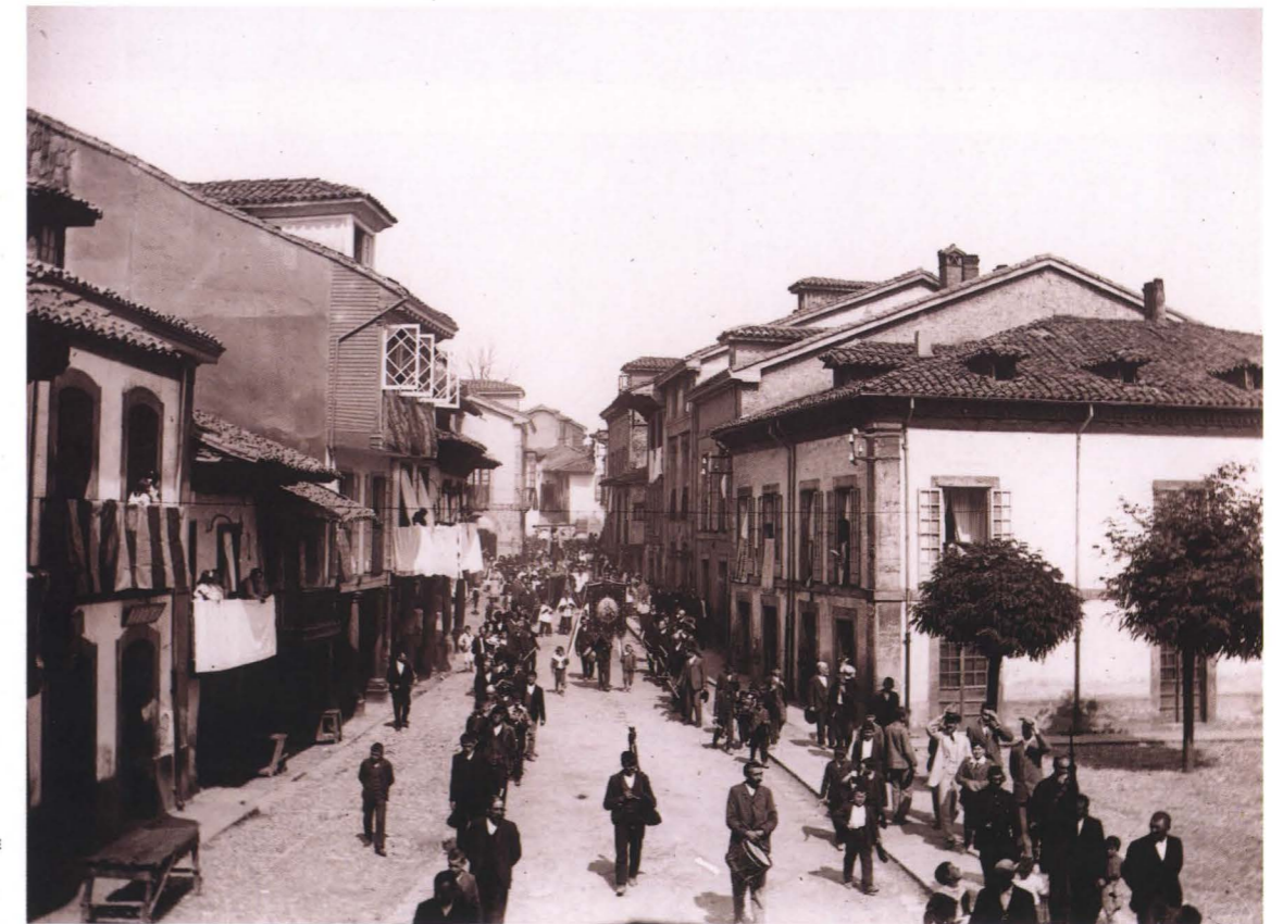
POLA DE SIERO: LA CALLE DE SAN ANTONIO DURANTE UNA PROCESION, hacia 1915. 10 x 15 cm.