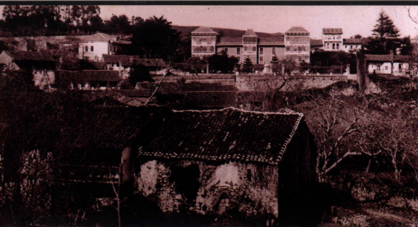
en portada: POLA DE LLAVIANA: PLAZA DEL GANADO , hacia 1915. 10 x 15 cm.